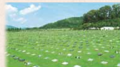
光と緑の大型公園墓地